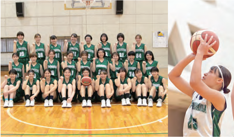
武蔵丘短期大学からの入職者（学生時代の様子）

社会福祉法人埼玉医療福祉会と学校法人後藤学園武蔵丘短期大学は超高齢化社会に対応すべく、介護人材の育成に貢献することを目的とした介護人材育成支援制度に係わる連携協定を令和4年4月1日に締結致しました。