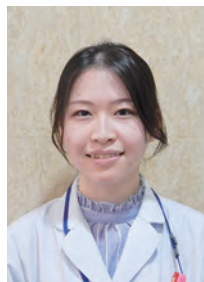
安藤精神保健福祉士